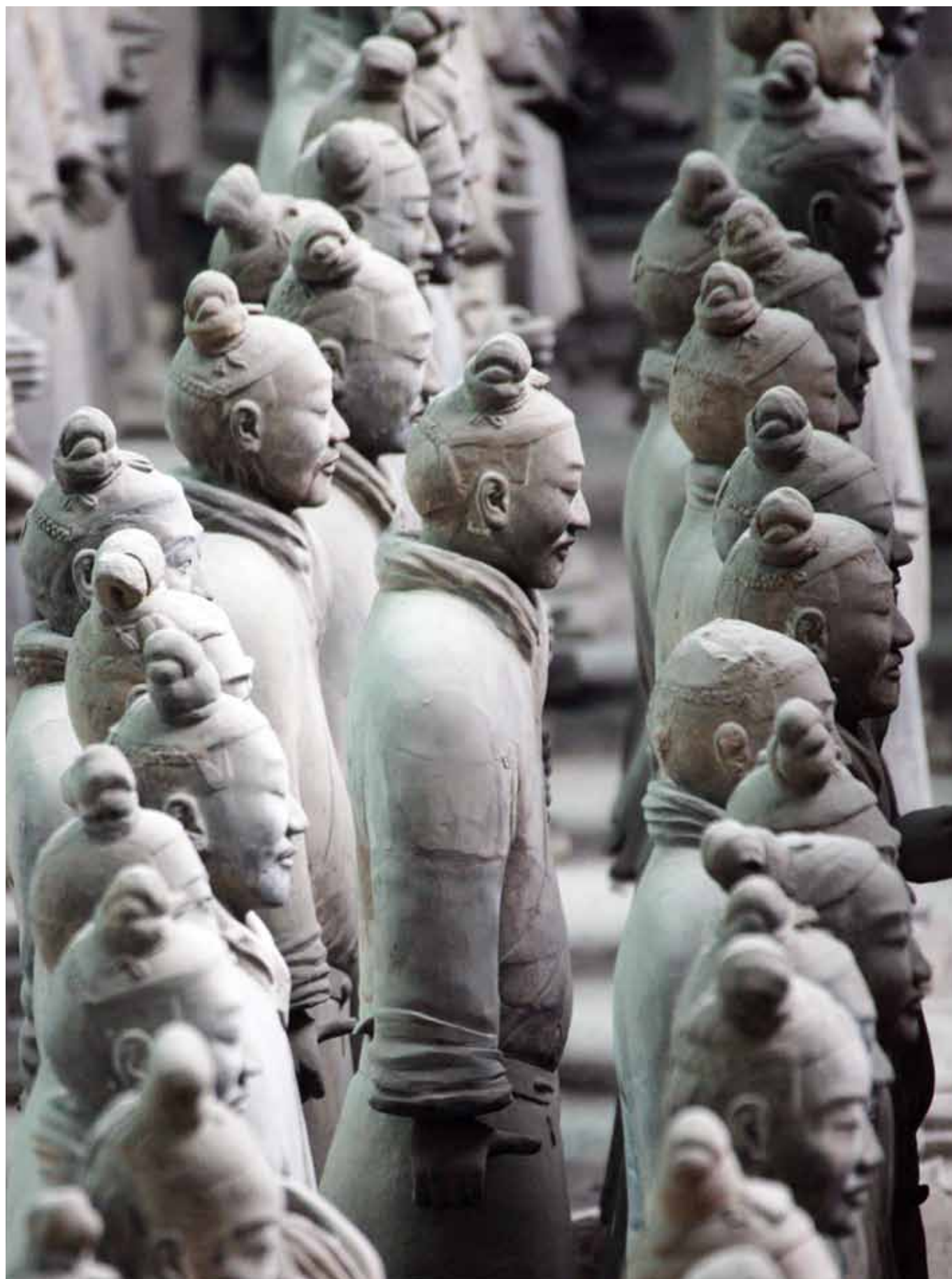
De mange figurer udgør en hel hær af fodfolk, bueskytter, officerer og generaler, der skulle beskytte Kinas første kejser.