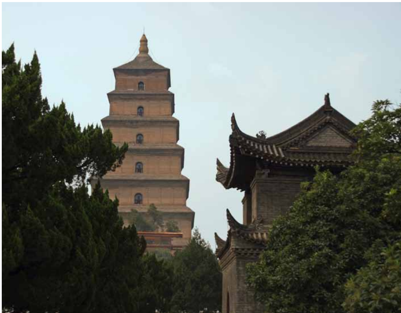
Den Store Vildgåspagode i Xian er et pragteksempel på kinesisk tempelarkitektur. Nyd udsigten over Xian fra toppen.