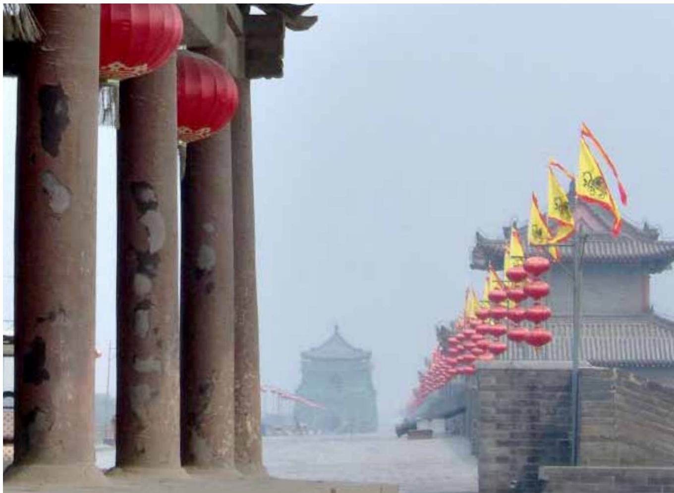
På jeres fridag i Xian kan man gå en tur indenfor Xians flotte bymure. Om aftenen danser de lokale i nærheden af muren.

er bevæbnet med langbuer eller katapulter. Andre står parat med spyd, daggerter eller økser. Omkring dem er der dusinvis af kareter trukket af kæmpestore terrakottaheste. Og indtil i dag er mere end 8.000 krigere fordelt i tre separate grave blevet af-dækket.