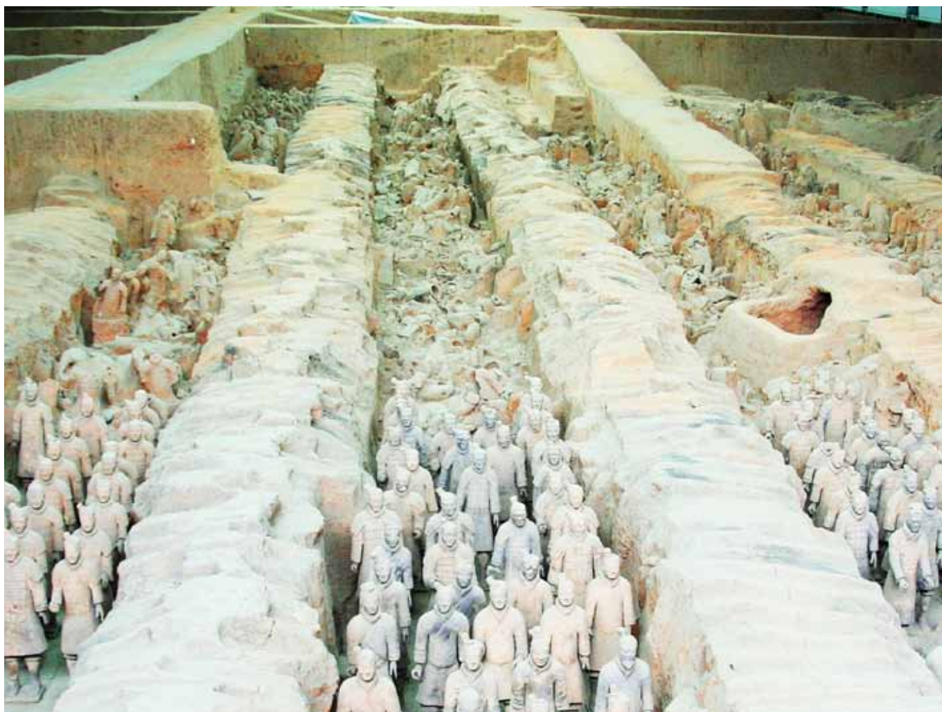
Hver og én af terrakottakrigerne er unik og har individuelle ansigtstræk og uniform. Hæren beskyttede kejseren i dødsriget.

Tilkaldte arkæologer har nu fundet tusindvis af dem, og de finder stadig flere. Så nu er det naturligvis den berømte Terrakottahær, som I skal besøge. De mange figurer udgør en hel hær af fodfolk, bueskytter, officerer og generaler, der er skabt for at beskytte Kinas første kejser, Qin Shi Huangdi, i dødsriget. Nogle krigere